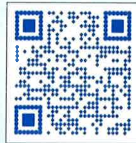
الاستبيان باللغة العربية